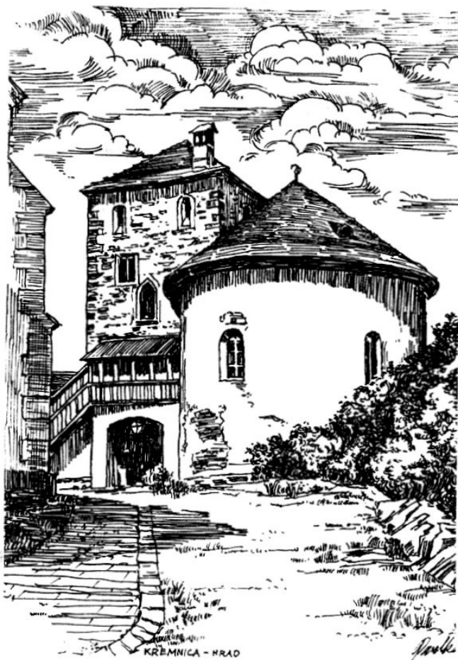
KREMNIČA - HRAD