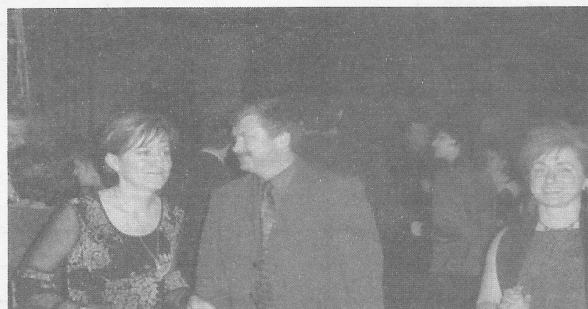
Zabávajúci sa účastníci VII. školského plesu.

Vo februári tohto roku zavítal do našej školy štáb Regionálneho vysielania 2. programu Slovenskej televízie s cieľom nakrútiť dianie zo života žiakov a učiteľov malej dedinskej školy v kopaničiarskom regióne Myjavská. Redaktorku vysielania STV zaujal predovšetkým internetový projekt „Kopanice Krajného a jeho okolia“, na ktorom sa podieľali žiaci ôsmaci a deviataci v minulom školskom roku a so svojimi prácami sa prezentovali na webovských stránkach školy a projektu INFOVEK. Diváci STV2 mohli sledovať niektorých žiakov našej školy pri projektoch, ktoré realizujeme v tomto školskom roku, ako sú „RoboLab“ a „Ukáž, čo vieš“ na hodinách predmetov „Práca s počítačom“ vo vysielaní STV2 27. februára 2004 v podvečerných hodinách medzi 17. a 19. hodinou. L.G.