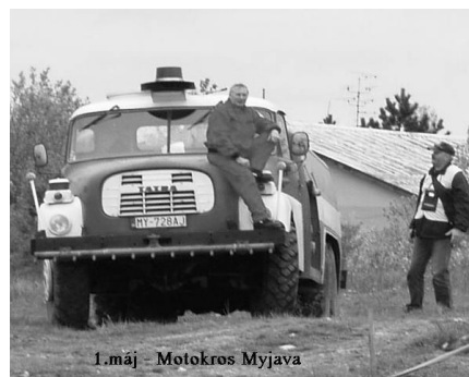
1.m j - Motokros Myjava