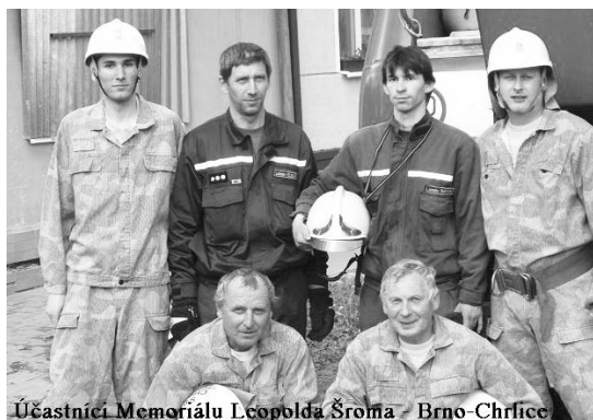
 astn ci Memori lu Leopolda Ŗroma - Brno-Chrlice