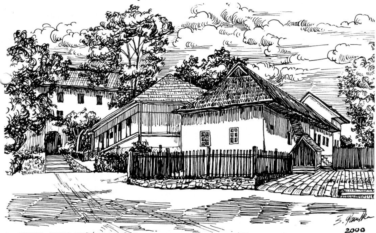
ZAJ UHROVEC, RODNÝ DOM L. ŠTÚRA A A. DUBĚČKA